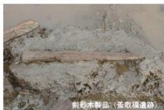
剣形木製品（葦取橋遺跡）